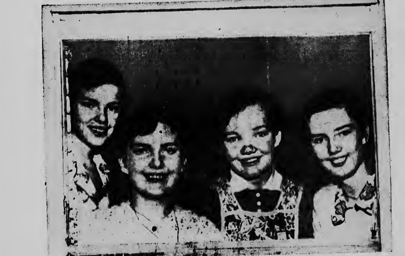
Enkele maanden geleden berichtten wij dat een heel gezin in Durand, Illinois (ouders en negen kinderen) naar het ziekenhuis moest worden vervoerd wegens acute kinderverlamming. Vier van de kinderen mochten deze dagen het ziekenhuis verlaten (hierboven), de rest is aan de beterende hand.